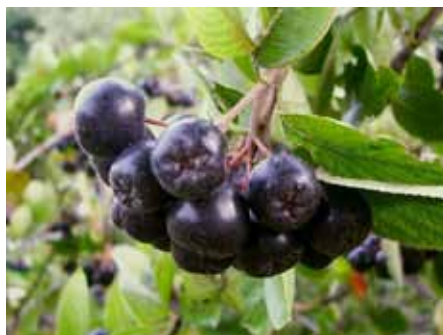
Aronia, fot. wikipedia

To niewielkie drzewko lub krzew występujący pospolicie w naszym kraju - ma czarne owoce o kwaśkowanym, cierpkim smaku, z których przyrządzać można dżemy, soki, nalewki oraz wina. Aronia to nie tylko składnik kulinarnych przetworów. Nie wolno zapominać o leczniczych właściwościach tej niepozornej, ale jakże użytecznej rośliny.